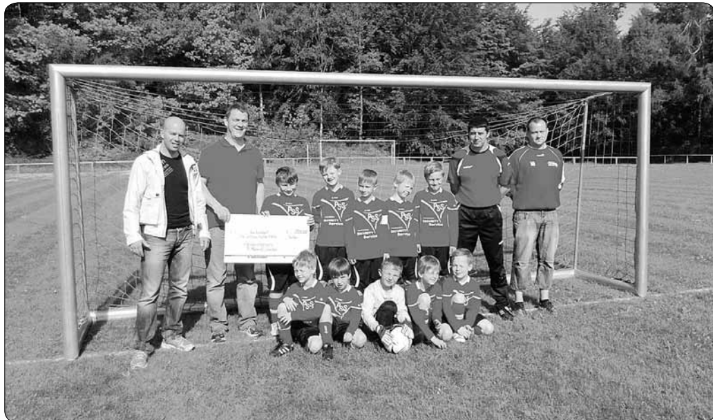
In schicken neuen Trikots laufen ab sofort die Nachwuskkicker des SV Viktoria Lauter auf.

Lauter-Bernsbach. Gerade sind die Feierlichkeiten zum 100. Bestehen des Fußballvereins SV Viktoria Lauter zu Ende gegangen, da kommt schon wieder Frohe Kunde aus den Reihen des Vereins. Anlässlich des Jubiläums spendete die Zahnarztpraxis Ralph Männel aus Lauter einen Betrag von 300 Euro an den Lauterer Fußballverein. Auch die Firma Professional Security Service (www.security-sachsen.de) unterstützt die Kicker und spendete die Trikots für die Kinderfußballmannschaft in der Hoffnung auf faire und gerechte Spiele. Beim Lauterer Verein wird eine hervorragende Nachwuchsarbeit geleistet. Kleine Kicker aller Altersklassen - von den Bambini bis zu den A-Junioren - trainieren hier.