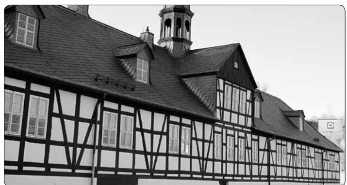
Herrenhof Erla.