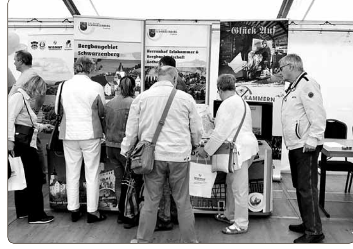
Großes Interesse am Stand der Stadt Schwarzenberg.

Bei der Festveranstaltung und dem Großen Bergmännischen Zapfenstreich anlässlich der offiziellen Übergabe der Urkunde zum UNESCO-Welterbe an die Montanregion Erzgebirge / Krušnohoří war auch die Schwarzenberger Knappschaft mit insgesamt 12 Bergbrüdern vertreten.