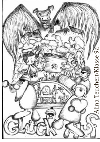
Alina Teuchert/Klasse 9a

Am 1. und 2. Oktober 2019 werden die Feierlichkeiten zum 130-jährigen Bestehen der Oberschule Stadtschule in Schwarzenberg begangen. Im Rahmen der Festveranstaltung wird auf Zeitreise gegangen und ein tolles Schulfest rund um das Schulgelände rundet die Feierlichkeiten ab. Hier hat sich die Oberschule ein tolles Programm überlegt – von Tanzschule über Theaterstück „Schule früher & heute“, Schülercafé mit Essen, ebenfalls von früher und heute, bis zur Bastelstrecke ist alles dabei. Am Schulfest nehmen neben den Schülerinnen und Schülern der Oberschule auch alle vierten Klassen der kommunalen Grundschulen im Stadtgebiet teil. Es