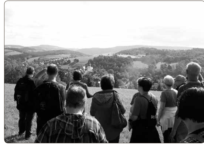
Wandergruppe auf dem Galgenberg mit Blick auf Schloss und Kirche.

beitung beachtet werden muss. Am Ende der Wanderung gab es für die Teilnehmer als kleine Überraschung noch Kräuterköstlichkeiten zum Probieren. Die Kräuterwanderungen werden regelmäßig durch die Schwarzenberg-Information einmal im Frühjahr und einmal im Herbst organisiert und sind bei großen und kleinen Gästen sehr beliebt. Der nächste Termin ist für April 2020 geplant.