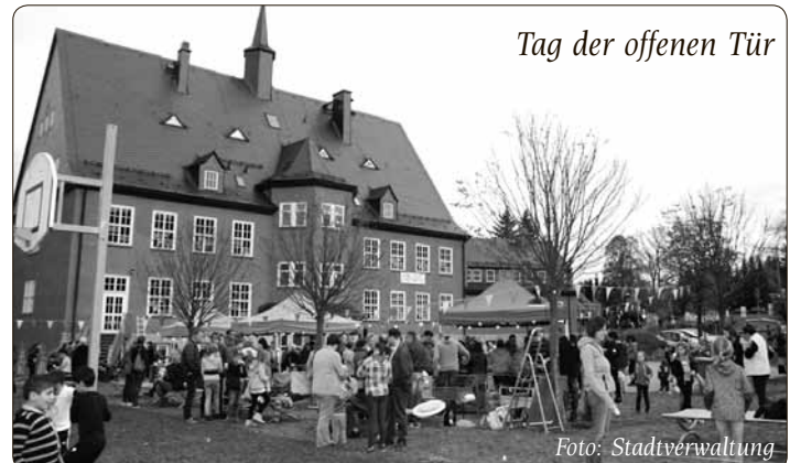
Tag der offenen Tür