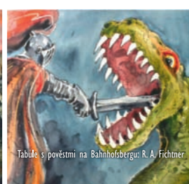
Tabule s pověstmi na Bahnhofsbergu: R. A. Fichner