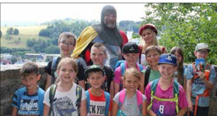
Mit Ritter Georg und Burgfräulein Edelweiß auf Spurensuche nach der Geschichte mit dem Drachen – Bild vom Ferienangebot PERLA CASTRUM - Ein Schloss voller Geschichte

22. Juli 2024 / 19:30 Uhr / St. Georgenkirche Veranstalter: Kantorei St. Georgen Schwarzenberg