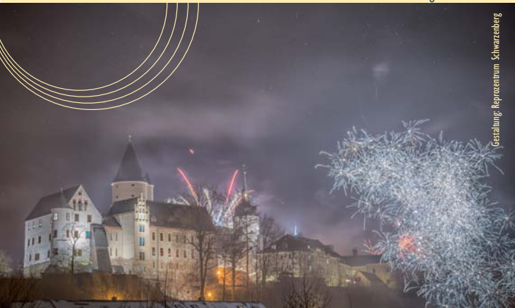
Gestaltung: Reprozenträum Schwarzenberg